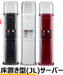
床置き型(JL)サーバー

床置き型(JL)サーバーご使用中、まれに水が出なくなる等の不具合が発生することがございます。 不具合防止のため、差込口を水気のない清潔な状態にし、差込棒にボトルセット補助リング(以下リング)をセットして下さい。 (差込棒に通すだけでOK！) その後ボトルをセットして下さい。