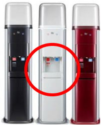
床置き型(JL)サーバー

※リングを装着しますとボトルセット時の安定性が高まり、差し込み不良等の不具合抑止に効果的です。安心してウォーターサーバーをご利用いただくためにも、ご協力をお願い致します。